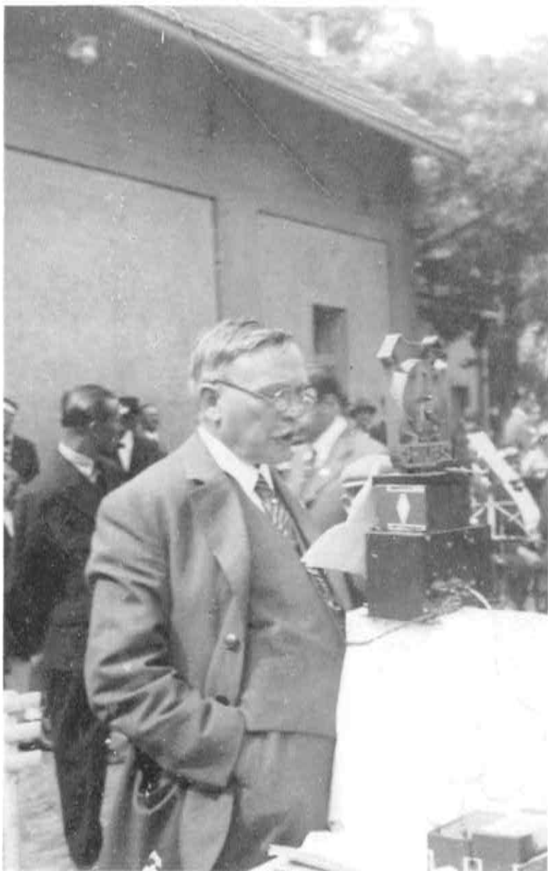
Josef Vaniček v roce 1940