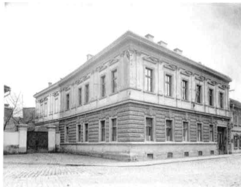
Nová budova městského úřadu