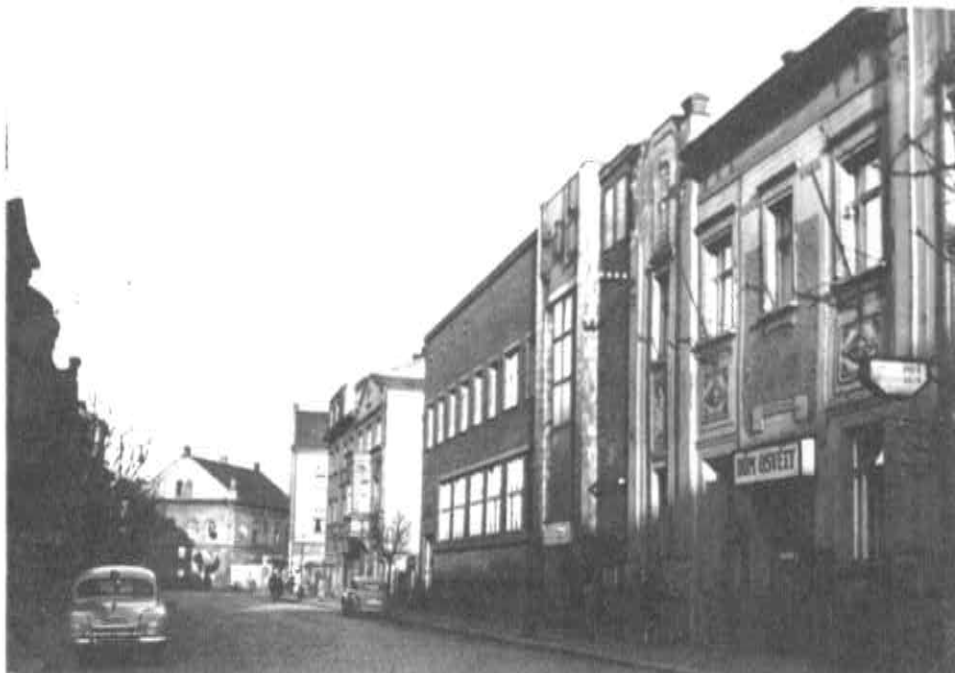
Budova kralupské pošty, Nerudova ulice