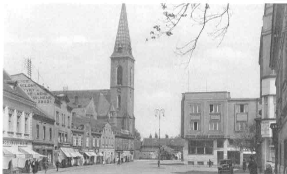
Náměstí s nově postaveným hotelem Praha, 1936