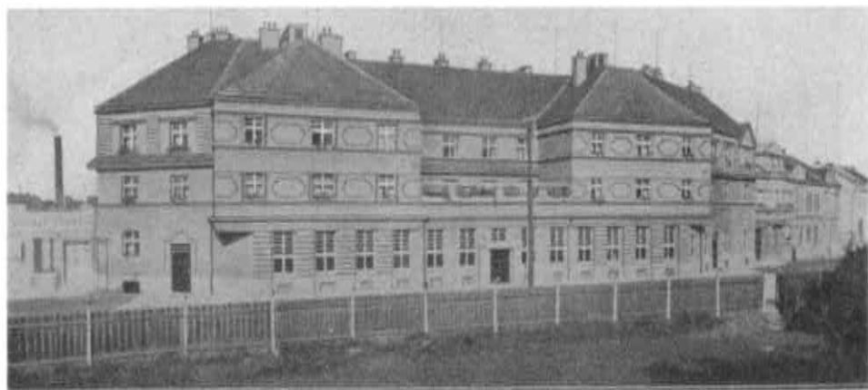
Budova Okresní nemocenské pojišťovny, Nerudova ulice