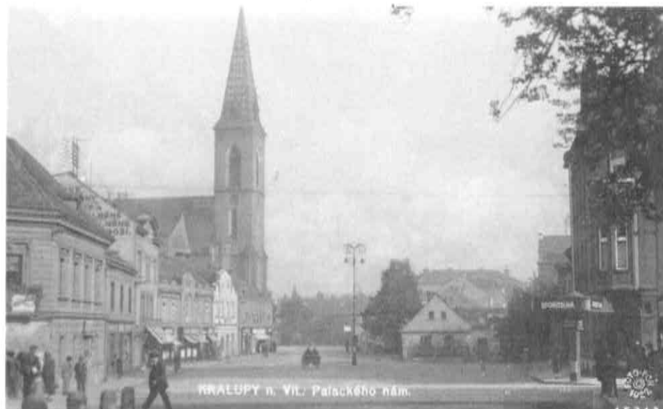
Náměstí se sloupem elektrického osvětlení, 1927