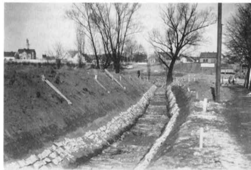
Regulace potoka v místě jeho ústí, 1924