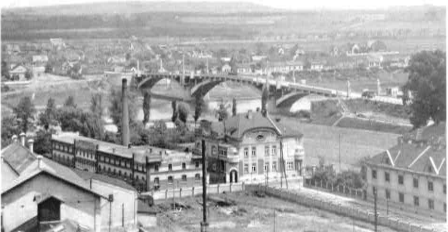
Nově postavený most, 1930