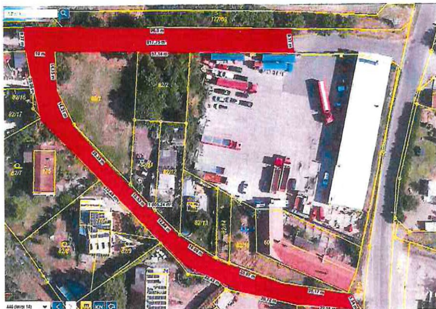
Pod lesem číslo 3c – p.č.: 82/5 Zlosyňská číslo 2c – p.č.: 665

Průběh Č.j. MUKV. 22099/27-2024-010606 POLICIE ČESKÉ REPUBLIKY KRAJSKÉ ŘEDITELSTVÍ POLICIE STŘEDOČESKÉHO KRAJE DOPRAVNÍ INSPEKTOÁT 276 01 MELNÍK 11.11.2024 M. G. J.