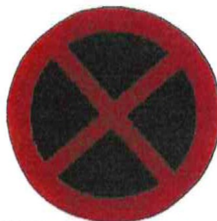
DZ B28 (Zákaz zastavení)

Blokové čištění pozemních komunikací ve městě Kralupy nad Vtávou v roce 2025